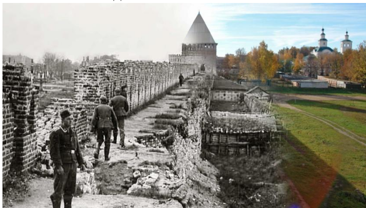
Смоленск. 1941-1943 гг.