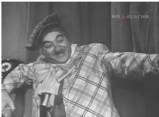
На фото В.Ю. Драгунский в гриме и костюме клоуна.

Виктор рано начал работать. Однако он не сразу стал писателем. Он был артистом театра и эстрады, несколько лет руководил театром «Синяя птичка».